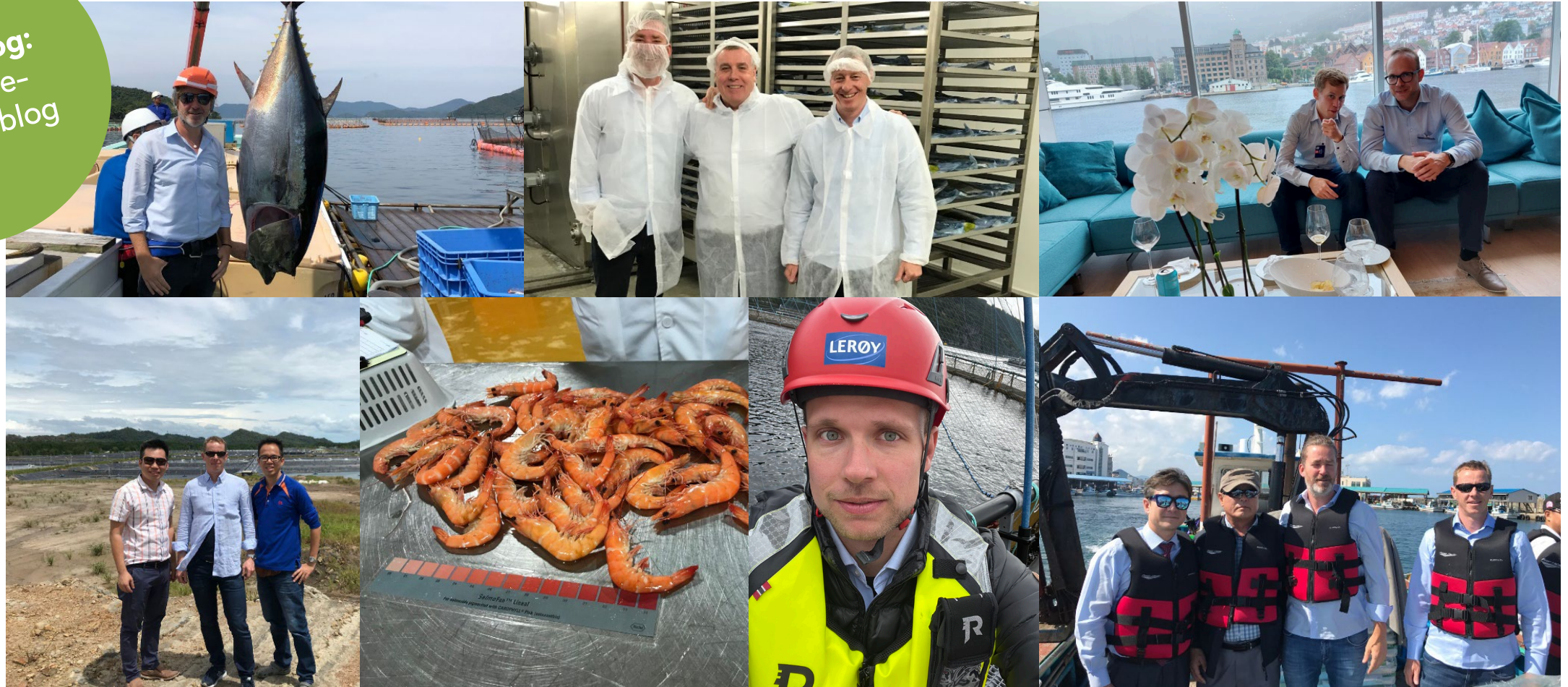
Bonafide Mitarbeiter bei Unternehmensbesichtigungen